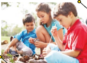
山田・千里丘・高槻

グローバルヴィレッジ インターナショナルプリスクール 千里山田校 吹田市津雲台7-4 ☎06-6831-8996 千里丘校 吹田市長野東3-15 ☎06-6878-6874 高槻茨木校 高槻市宮町3-4-10 ☎072-694-6000 http://www.global-edu.jp