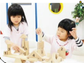
週1回500円ワンコインの英語レッスンも大人気!

「自分でやるという気持ちが出てきました」と保護者からの声。国語・算数・英語からレッスンが選べ、経験豊富な講師がオリジナル教材を使って教えてくれる。その子の個性を見て可能性を引き出す仕掛けが満載!1度体験へ。