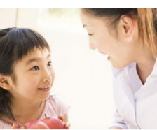
わくわくデンタルグッズプレゼント 50組限定 入場無料です。

同じ症状でも医師によって治療法や治療方針が異なる場合があります。どの治療法が患者さんに最適なのか判断できるのは歯科医師のみです。その判断が正しいかどうかという不安を解消するためにもセカンド・オピニオンは重要な役割を果たしています。相談を受けるほとんどは、今かかっている先生の治療法が悪いというのではなく、他に治療方法はないのですか? 最善の選択肢は? というご参加ください。