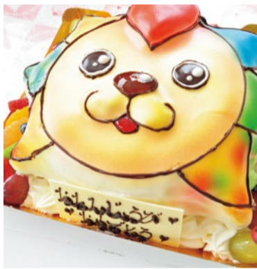
キャラクターだけでなく似顔絵ケーキもOK。お早目のご予約を!

オリジナルのデコレーションケーキが評判の「Heartful」が眞面彩都に新しく2店舗目をOPEN。デコケーキに加えケーキ屋さんならではの日替わりジェラートの販売もスタートし、より一層パワーアップ。季節によって種類は変わっていき、この時季ならフルーツ系が断然オススメ。ケーキも豊富に取り揃えており、記念日やお祝いごとにはデコケーキをぜひ。王道の実力派が手掛ける見た目にも楽しいケーキはどれも喜ばれること間違いなし!