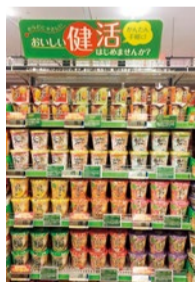
▲同社がすすめる健活コーナー。本品のほか、「スープはるさめ」「Pho-ccori気分」「麺ごち 糖質50%オフ」「どっさり野菜」などの健康志向をテーマにした商品を多く展開している。

特定保健用食品(トクホ)や栄養機能食品に続き、機能性を表示できる新たな制度。2015年4月より開始された。事業者の責任において、科学的根拠に基づいた機能性を表示する食品として消費者庁に届け出されたもの。