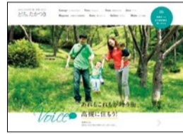
▲定住促進の特設HP「たかつきウェルカムサイト」。 http://www.city-takatsuki.osaka.jp/welcome

も充実していて、古き良き文化が残り、これからの発展もある」と説明する。主要鉄道駅や鉄道車両への広告掲出、インスタグラムを活用した市民参加型企画、各種イベントへのPRブース出展など、それぞれの媒体の特性を生かしたプロモーションを積極的に展開している。