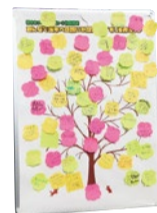
▲ブランドメッセージ(ロゴ)は、イベントなどを通じて得た約2,700人の「茨木の想い」をもとに案を作成。市民投票を経て決定した。

と、ずっと元気にする」を目的として、十分に伝わっていないとする市の魅力を市、市民、事業者・団体が丸となって市内外に効果的・戦略的に発信するとしている。「まちのイメージ形成」「まちの魅力の発掘・創造」「情報発信の強化」を3つの柱として位置づけ、市のブランドメッセージ(ロゴ)「次なる茨木へ。」を作成した。また、市内の魅力ある活動内容についてきめ細やかに情報を収集し、インターネットや紙・放送媒体など複数の媒体を活用して、情報発信を強化する。テレビや映画のロケーション誘致なども進める予定だ。