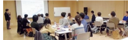
▲市民対象のワークショップを開催して市の魅力を再発掘、または発見してもらうことが狙いだ。

ない発想で、組織の垣根を越え、横断的にフレキシブルな活動が実施できる体制を作る動きだ。