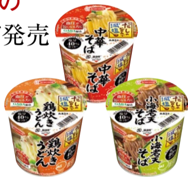
▲左から鶏炊きうどん/中華そば/小海老天そば、各113円(税抜)。全国のコンビニやスーパーなどで販売している。

が高まっていることを受けて、消費者がより対象商品を見つけやすくするため、全国の販売店などで他社製品も含めた「健活コーナー」の売り場づくりを提案している。健全な食生活を意識した活動を「健活」とし、導入した店舗は、全国で2,100店舗(2017年4月時点)を越えた。担当者は、「カップめん業界全体として盛り上げられ」と話す。