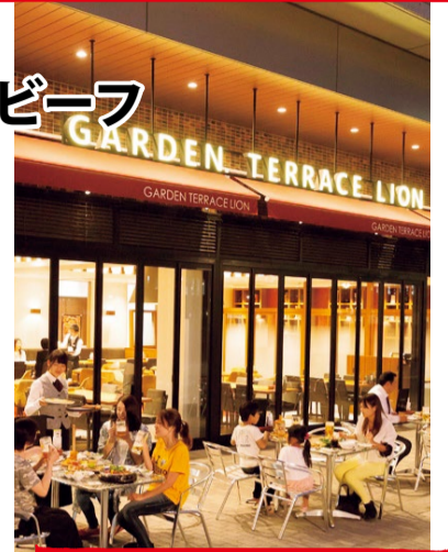
ビアガーデンプラン 1,000円~