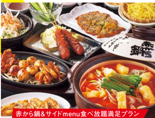
赤から鍋&サイドmenu食べ放題満足プラン 2,980円(税別)

赤から鍋食べ放題は、名物手羽先唐揚げを含むサイドメニューや鍋のトッピング追加、鍋後のパ(雑煮や赤からきんなど4種)など約70種類が食べ放題! ※アルコール飲み放題+1,300円。ソフトドリンク飲み放題+600円。※利用は2人前~