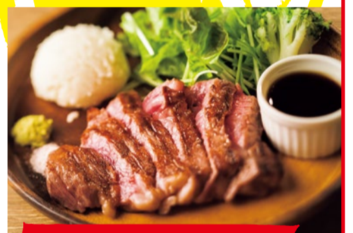
国産黒毛牛希少部位 100g 990円~

国産黒毛牛希少部位の中で一番人気はイチボ。その他希少部位を100g990円~と衝撃価格で提供する。誕生日や記念日で来店する人が多くサプライズ企画も人気の一つ。また魅力がギュッと詰まったコースはビールやワインも飲み放題で女子会やママ会に人気だ。