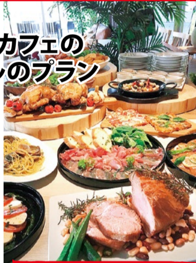
プレミアムコース(全10品) 3,500円

オードブル盛合せ、サラダ、タコのジェノバ風サラダ、フィッシュ&ポテト、ピッツァ、本日のパスタ&カレー、小海老と茸のアーヒージョ、ローストポーク、デザート ※予約は10名様~