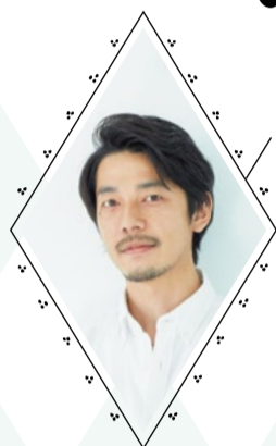
この方に伺いました