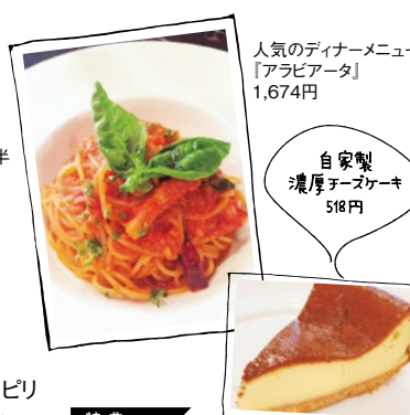
人気のディナーメニュー「アラビアータ」1,674円

4 IL Grato (イルグラート) 西宮市二見町4-21 アルテック甲子園 1F 営/ランチ11時半~14時半(L.O14時) ディナー18時~22時(L.O21時半) 月曜定休 ☎0798-66-7008