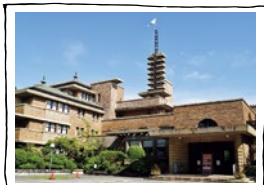
壁面彫刻も美しく、訪れた者を魅了する、日本に残る数少ないライト式建築

1965年武庫川女子大学が譲り受け、現在はキャンパスとして有効活用されている。人々に愛され続けている名建築を見学してみよう。