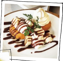
チョコとバナナのドーナツデセル...850円

3 Cafe' she's (カフェ シーズ) 西宮市甲子園口3-16-8 営/9時~18時 月曜定休 ☎0798-67-0505 http://www.at-ml.jp/73093/