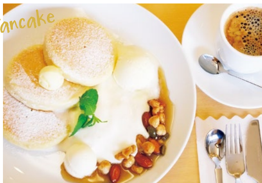
北海道ハニーナッツ 単品1,296円 ランチタイムにはプラス200円で有機栽培のコーヒーか、紅茶をセットにできる