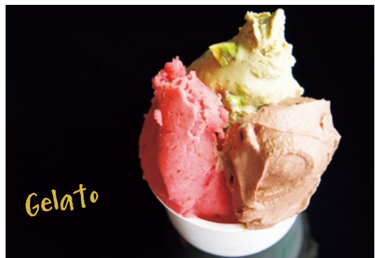
究極のイチゴ、ピスタチオ、ショコラのトリプル 950円 単品(各450円~) お店の人気商品。甘酸っぱさや香り、コク深さが揃った味は絶品

特典 「シティライフを見た」とディナー注文の方はデザートミストを1組1皿プレゼント(7月末まで) ※デザートは日によって変更