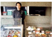
東京やフランスでのパティシエ経験から完成したSeno流デザートは、本格派でこだけの味