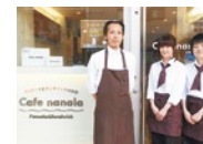
nanalaはハワイ語で「ひまわり」。太陽に向かい、まっすぐ正直にという思いが込められた店名

Chocolatier Yasuhiro Seno KOBE ＜シヨクラティエ ヤスヒロ セノ＞ 神戸市中央区御幸通 2-1-26 M&Cビル1階 営/11時~19時 月曜、第1・第3火曜定休 TEL.078-862-1890 www.yasuhiro-seno-kobe.com