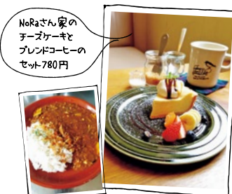
NoRaさん家のチーズケーキ プレミアコーヒのセット780円

2 cafe NoRa (カフェノラ) 西宮市甲子園口4-7-14 梶原マンション101 営/9時~18時 (金曜日のみ11時~20時) 不定休 ☎0798-64-5115