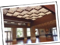
1F西ホール 高松宮をはじめ、中国のラストエンペラー愛新覚羅溥儀も訪れたそう