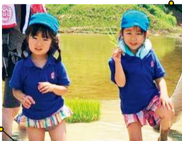
▲大自然の中、みんなで田植体験!