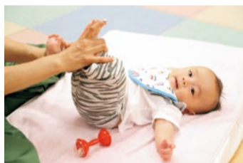
手遊びや声掛けの意味やその効果、タイミングなどを、ママがしっかり理解したうえで行うと子どもに与える効果が全く違ってくるそう。明日からの育児がもっと楽しくなるちょっとしたコツを学ぼう。

「親子の愛情の絆ほど子どもの能力開発に深く影響するものはありません。」と語るBabyParkは、愛情を土台にした育児法で子どもの能力をぐんぐん伸ばしていく。特に0歳～3歳はとても大事でこの期間に脳の約80%が完成するそう。知識の詰め込みではなく、IQ・EQといった能力が高い子に育つための土台作りは、日常でのママとの過ごし方にある。「ママのための親子教室」だからわかるその秘密を今だけの無料体験会で感じてみよう。