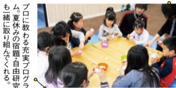
プロに教わる充実プログラム 夏休みの宿題自由研究 も一緒に取り組んでくれる

子どもの笑顔が溢れ、「ここまでしてくれるなんて!」と保護者満足度も高い同スクール。朝8時～21時まで小1～6年の誰もが利用できる。週に通う回数も選べ、スポット・夏休みだけの利用もOK!キッズアート・ダンス・英語など充実のプログラムも受講できる。送迎サービスがあるから安心!詳しくはお問合せを。