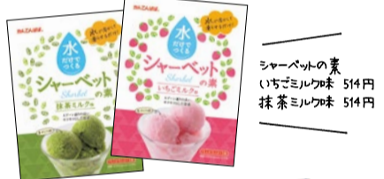
シャーベットの素 いちごミルク味 514円 抹茶ミルク味 514円