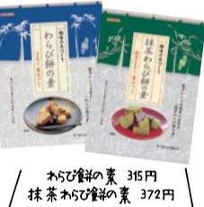
ねらび雑穀の素 315円 抹茶ねらび雑穀の素 372円

“健康”と“ちょっと手づくり”がコンセプトで、手軽に作れる寒天商品が約200種類以上も揃う寒天の専門店。寒天は腸内フローラのバランスや健康寿命のテーマでテレビに取り上げられるなど今とっても話題に。試食スペースもあるので、ぜひ気軽に訪れてみて。不定期で旬の信州直送野菜を販売。