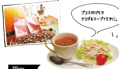
プラス191円で サラダ&スープ付きに。