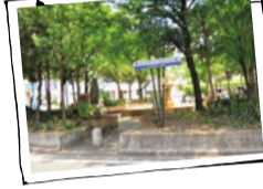
かつては、第一から第五まで噴水があったが、現在は第一と第二のみに。第一噴水は千里山西地区の中心で、ここから放射状に道が分かれている。