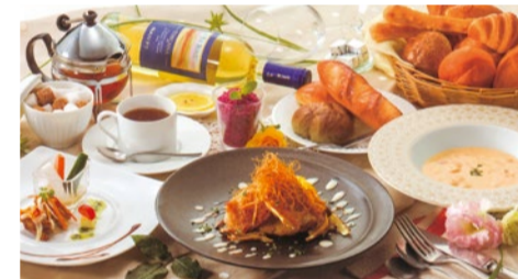
「ランチの女王コース」(全6品)1,290円~(税別)。スープ・前菜3種盛り合わせ・メイン4品より選択・デザート(4品より選択)・焼き立てパン食べ放題(ライス)・飲み物。※男性もOK・15時まで・土日提供