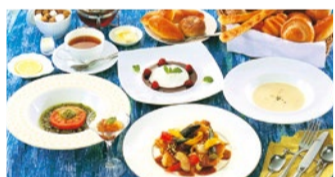
「季節のコース 夏」(全7品)2,500円~(税別)