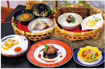
「いろは御膳」は読者限定で500円引きに!