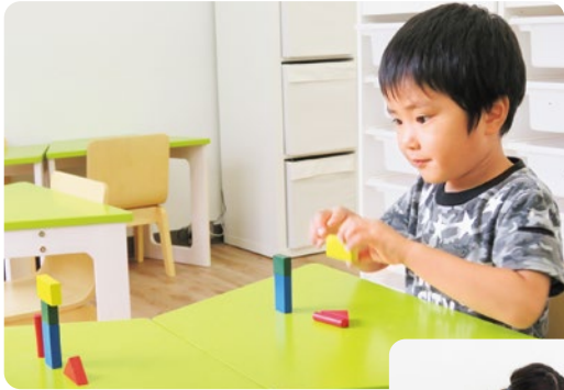
(上) スタッフの作った見本通りに積み木を並べる。目をキラキラと輝かせて、集中して取り組み、完成後にはとびきりの笑顔を見せてくれた。 (右) 体に触れられるのもいやがっていたKくんも今ではスタッフとスキンシップを楽しめるまでに。