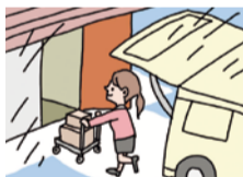
荷物の出し入れがしやすい内廊下タイプ。天候も気にならず、使い勝手は抜群!