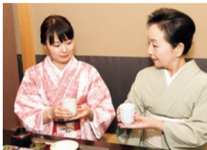
貴方も、素敵なきものライフを愉しもう

京都きもの学院でついにスタート 着物の着方と現代マナーを学ぶ新講座 着付けの伝統校で 受講生を募集中 45年の歴史を持つ着付け専門校「京都きもの学院」で8月、新たに「きものde現代マナー講座」が開講する。短期間で正しい着付けや日本女性の美しい所作を学ぶというもの。20万人以上の卒業生を輩出した伝統校の初めての講座で、受講生の募集が始まった。 全4回を通して、きもの楽しみながら深い日本文化に触れられるのが同講座の特徴。うち1回は、ミシュラン1つ星のお店で和食マナーの実習。きものを着ておいしいランチをいただきながら、正しい食事マナーを身につけられる。大阪、兵庫、京都、滋賀に8教室で、どこも駅から近くて好アクセス。練習用の着物や名古屋帯を無料でレンタルできるのもうれしいポイント。魅力いっぱいの講座で、最初の受講生になろう。 全4回の短期間コースだが、充実した内容の講座となっている。