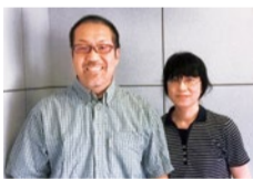
管理人夫妻が常駐しているので安心。何かとサポートしてもらえるのも頼もしい。

25年の実績がある山栄地所が運営する「西宮トランクルームII」。広い駐車場や屋根付きの荷さばき場があるのが特長で、雨でも濡れずに出し入れができる。また、住み込みの管理人夫妻がいるので女性の利用や夜間も安心だ。広さは2タイプから選べ、家庭内の荷物の保管場所としてはもちろん、仕事の道具や在庫置き場としても便利。台車の無料貸し出しや荷受け代行などのサービスも好評だ。まずは気軽に見学。使い勝手のよいトランクルームを活用して、暮らしやビジネスを快適にしよう!