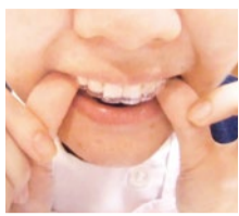
(上)インビザラインとアソアライナーは目立たない透明の矯正器具。

歯には1本1本役割があります。当院では、できる限り健康な歯を抜かず、ご自身の歯を使って美しい口元を目指します。透明なマウスピース型のインビザラインは、付けれ外し簡単で、年代問わずご利用頂けます。また、院内でセラミック歯を作成し、安価でご提供しています(即日装着の可)。不可などはご予約時にご相談を。治療費が不安な方には、無料相談会を毎日受付中です。