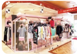
バス停に面したショップ。最高級のイタリア製の牛革バッグも一部セール中。

ヤングミセスから80代まで幅広い層の女性に人気のセレクトショップ。素材とデザイン、着心地にもこだわって選ばれたアイテムはどれもセンス抜群。とろみのあるサマーワンピースは緑と紺のデザインがオシャレ。トップス&ボトムも様々なアイテムが揃う。