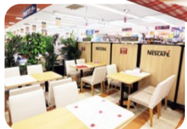
2Fサービスカウンター前に出来たイトインスペースで食べることもできる。アイスソリュブルコーヒー(162円)と一緒に!