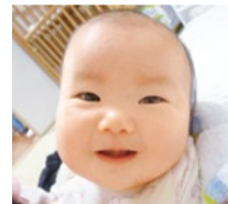
数多くの妊娠実績あり。喜びの声など、詳しくはHPで。

煎じ薬、粉薬の調合も行う北摂でも数少ない漢方専門薬局。子宝相談は評判で同店の得意分野。クチコミで県外から通う方も多く、妊娠した4人に1人が40代という。細かく時期や体調を見ながら、「今」必要な漢方で体を整えていく。医師との勉強会にも参加し日々進歩する生殖医学にも通じており、不妊治療の方には治療内容に即した漢方を処方してくれるので心強い。