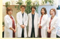
当クリニックの培養士

当院では、受精卵の細胞分裂確認時に、新たに「胚自動解析システム Eevaシステム」を導入しました。培養器Geriと自動解析評価システムEevaを組み合わせ、胚のグレード1から5までの評価を自動で行い、同じ初期胚や胚盤胞の中から、より良好な胚を選択し移植します。それにより、流産率の低下が期待できます。