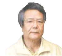
澤田院長 大阪歯科大学卒業。75年から箕面市に開業。

では、オーラルコンパスという器具で計測すると、その人に合った入れ歯を作れて問題を解決できる可能性がります。その他にも、一人で我慢していることも新しい切り口でみると問題解決に繋がる可能性があります。