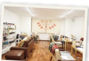
お一人様席や、友達と一緒にワイワイできるソファ席もあり、家にいるような感覚でリラックスしてネイルが楽しめる。

リサーチの結果、慣れ親しんだ土地ということもあり江坂にお店をオープン。今年6月にはフットネイルを導入。これからの目標を伺うと、「将来は店舗を各地に展開することで、一人でも多くの方がハッピーに過ごすお手伝いをしていきたいです」と話してくれました。