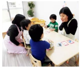
▶公営住宅の空室を活用した、豊中市の一時預かり保育施設(左)と島本町の小規模保育所(上)。