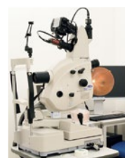
散瞳型眼底カメラ 眼底写真を観察することで糖尿病網膜症や加齢黄斑変性症などの眼底疾患や全身疾患のリスク予見に役立てられるとされている。

眼 科内には、診察室や視力検査室、造影検査室、レーザー室、視野・ERG室などを完備。専用の手術室も確保している。それぞれの室内には白内障、緑内障、網膜剥離、角膜移植など、さまざまな眼疾患の検査や手術の精度を高める最新の機器が揃っている。