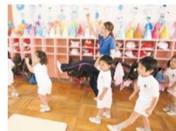
担任の先生は一人ひとりの生徒の個性を生かすつ、クラスとしての絆や、まとも大切に育てていく。