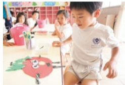
はさみなどは、子どもたちにきちんとルールを守ってもらうことで、いつでも自由に使えるようにしている。