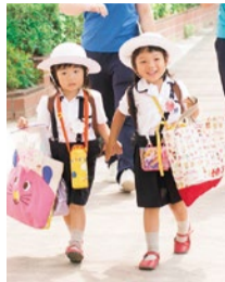
バス通園では年上の子が下の子の面倒を見るのが山手流。