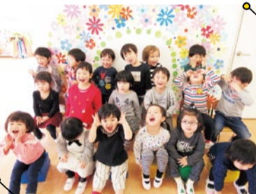
子ども達は1年間で心身ともに本当に成長します!

保護者の声 五感を使って色々経験をさせてもらっていることで、お話が上手になったり子どもの成長をすごく感じています。先生方も日々の様子や成長を丁寧に教えてくれて、いつもとっても楽しそうに通っています。