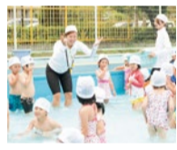
この日は年少の子どもたちがプール。水を浅めに張り、スノーボール拾いなどで楽しく水に慣れる工夫も。

平成29年9月2日(土)、9日(土) 9時30分～11時30分(受付8時30分) 【対象】入園前のお子様と保護者様 【持ち物】上靴(保護者様も上履き)、水筒、タオル、靴袋【服装】動きやすいもの ※雨天実施。荒天時は中止となります。 中止の場合はHPでお知らせいたします。