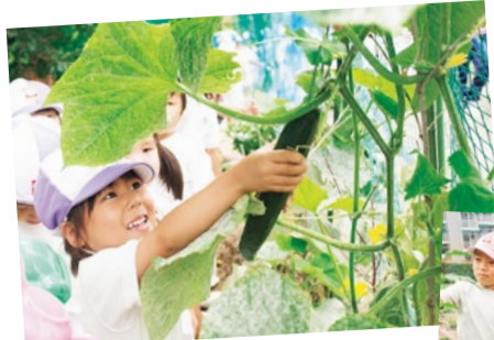
園内にある大きな畑にはクラスごとに植えた野菜に毎日水やりをして成長を確認。収穫した野菜は調理され給食に登場する。