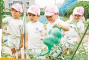
自分たちで育てて食べる「食育」