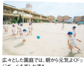
広々とした園庭では、朝から元気にドッジボールを楽しむ姿も。