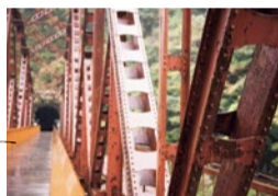
トンネルを抜けると現れる鉄橋。