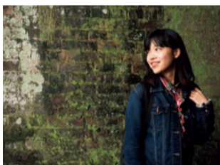
読者モデル：摩耶さん

日帰り入浴料 (11時~15時) 大人(中学生以上) 1,800円、小学生以下無料 ☎0797-91-0131 https://www.takedao-onsen.jp