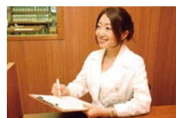
昌子先生は北海道出身で、優しい雰囲気魅力。