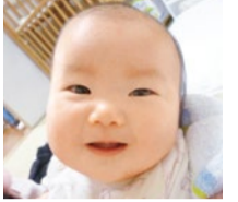
数多くの妊娠実績あり。喜びの声など、詳しくはHPで。

煎じ薬、粉薬の調合も行う北摂でも数少ない漢方専門薬局。子宮相談は評判で同店の得意分野。とりわけ内膜や卵の質の分野では噂を聞き、東海や関東からも来局される。高齢の方も多く、妊娠した4人に1人が40代という。細かく時期や体調を見ながら、「今」必要な漢方で体を整えていく。精子数、運動率の改善実績も豊富で、自然での妊娠を希望されている方にも心強い。