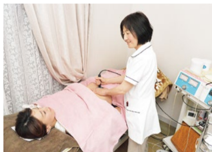
痛みを軽減し、親身に相談にのってくれるので安心。