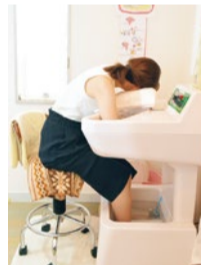
血液が浄化され、体が本来もっている自然治癒力を引き出す効果があるゲルマニウム温浴。

「体外受精でも授からない」「原因のわからない多嚢胞卵巣で妊娠できない」など、赤ちゃんを授かりたいと悩む女性に数多くの治療実績を誇る同院。東洋医学的検査により、不調な原因を調べ、N.O.E(高周波治療器)で「細胞を活性化」させ、更に鍼灸(無痛)で一人ひとりの「妊娠する力」を高め、体本来の力をとり戻していくのが特徴。多数の方が妊娠され、喜びの声が届いているそう。諦めないで一度相談してみてもいい。