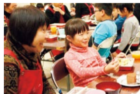
社協では、集まった食品の一部を子ども食堂に利用した。