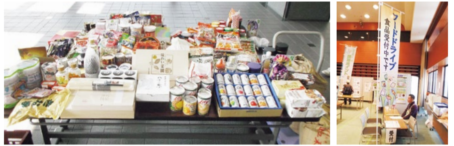
(右上)昨年11月に茨木市で行われたフードドライブの受け付けブース。 (左上)昨年10月に豊中市役所で行われたフードドライブで集まった食品約121kg分。

家庭で余っている食品を開催告知された日に持ち寄って地域の福祉団体などに提供し、食を必要とする人々に届ける活動をフードドライブという。社会貢献と同時に食品の無駄な廃棄を抑制する効果があるとして全国的に広がりつつあり、北摂も取り組み始めている。