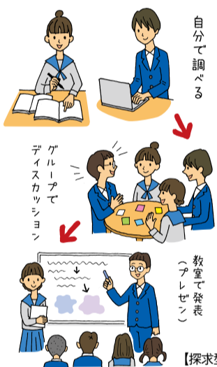
【探求型学習の一例】

さらに、考えたことは、実行（実践）されなければ意味がありません。とくにこれからは、環境問題やエネルギーの問題、人口問題など、国をまたいで皆で協力しながら解決しなくてはならない課題がたくさんあります。日常生活や社会、環境の中に問題を見つけて出し、自分の知識を総動員して、社会にとって価値のある答えを導くことができる人を育成しなくてはなりません。