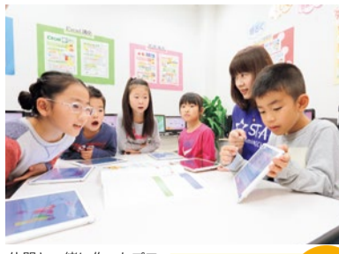
仲間と一緒に作ったプログラム作品を、みんなの前でプレゼンテーションする場面。「教室に通ってからの子どもの積極性がアップした」と保護者の声。

「スタープログラミングスクール」は全国で既に40教室開校。プログラミング学習は「自分で目標」を立て、それを実現させるために何度も試行錯誤しながら「課題を自ら見つけ、問題を解決する力」が身につく。それにより自己肯定感が強まり、何事にも自信を持って取り組むように!少人数制クラスで、振替授業や補講対応を受けられるのが嬉しい。保護者の方の授業見学も随時OK!まずは問合せを。