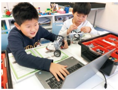
子ども達は学んでいる意識ではなく、「楽しい」と思うことに時間を忘れて没頭し、なぜ?どうして?を自ら解決することで自然に理数系の勉強と向き合っているそう。

プログラミングを学ぶ事に主眼を置くのではなく、ロボット製作を通じて理数系に強い子に育てる事を目的とし、プログラミングはその為の「ツール」と考える同校。ロボット製作には科学の要素が満載。低学年からレゴブロックを使って楽しみながら難しい原則原理を学ぶ。子ども達は夢中で製作に取り組み、創造する中で起こる問題の解決方法を自ら導き出すようになるそう。まさしく21世紀に必要なスキル!まずは無料個別体験・説明会へ!