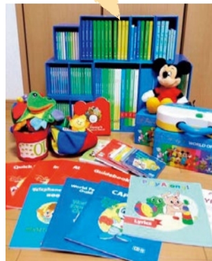
ディズニー英語システム・七田式・中央出版など買取例は多数。資格取得教材(フォーサイト・TAC)、有名塾の教材や通信教育教材・知育玩具なども。