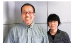
管理人夫妻が常駐しているので安心。何かとサポートしてくれるのも心強い。

25年の実績がある山栄地所の「西宮トランクルームII」。広い駐車場や屋根付きの荷さばき場があり、雨の日でも濡れずに荷物の出し入れができる。住み込みの管理人夫妻がいるのも特長で、セキュリティ面でも安心。女性や夜間の利用者に好評だ。広さは2タイプから選べ、台車の無料貸し出しや荷受け代行などのサービスがあるのも便利。「荷物が増えて家が手狭になった」「仕事道具や在庫の保管場所がない」「営業所として気軽に使いたい」そんな要望に応えてくれるトランクルーム。ぜひ一度見学し、使い勝手を確認してみよう。