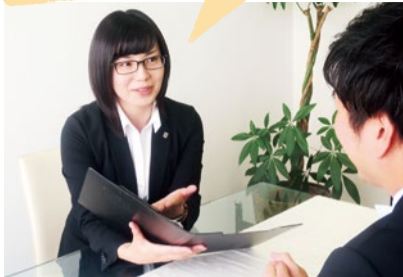
空き地・空き家の悩みは人それぞれ。諦めていた人も解決の道が見つかるかも。

同社では、阪急不動産やNPOとコラボし、不動産資産を“プラスの資産”として活用・運用するための無料セミナーを定期的に開催している。