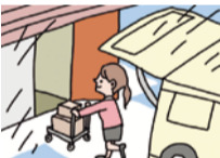
使い勝手のよい内廊下タイプ。天候を気にせず大切な荷物の出し入れができる。