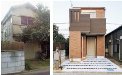
活用事例/元はオーナーの実家で、両親が他界されて空き家。オーナー自身は遠方在住で戻る予定はないが、実家近隣に住む親族に、ゆくゆくは譲渡したいと考え、将来自宅に転用もできる戸建賃貸経営を選択。

同社では、阪急不動産やNPOとコラボし、不動産資産を“プラスの資産”として活用・運用するための無料セミナーを定期的に開催している。