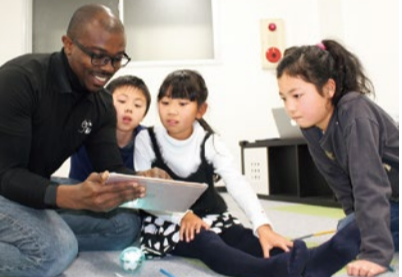
タブレットやプロジェクターを使ったニュースタイルのレッスンに子どもも夢中!