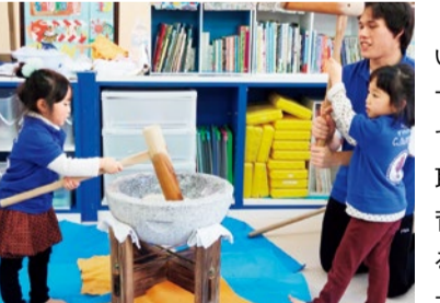
1月はお餅つき!季節のイベントいっぱい楽しい!

吹田 English School イマジンJAPAN CLOVER児童園 (クローバー) 吹田市上山手町21-28 メゾンティン2F ☎06-6368-3412 http://www.suita-clover.jp/