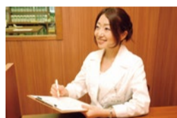
昌子先生は北海道出身で、優しい雰囲気魅力。