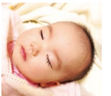
数多くの妊娠実績あり。喜びの声など、詳しくはHPで。

煎じ薬、粉薬の調合も行う北摂でも数少ない漢方専門薬局。子宮相談は評判で同店の得意分野。とりわけ内膜や卵の質の分野では噂を聞き、東海や関東からも来局される。高齢の方も多く、妊娠した4人に1人が40代という。細かく時期や体調を見ながら、「今」必要な漢方で体を整えていく。精子数、運動率の改善実績も豊富で、自然での妊娠を希望されている方にも心強い。