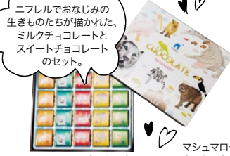
マシュマロチョコWT (10個入) 650円

「夜にふれる」 昼とは違う姿にドキドキ あるみたいですので、ぜひ活用してお得に楽しんでください。