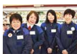
チームワーク抜群のメンバー