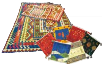
(左上)柔らかな暖色系の糸で織り上げた遊牧民のセンスがあふれる幾何学模様のアフガニスタンキリム18,000円(100X150cm)～ (右上)自由でモダンなデザインが魅力のペルシャギャップ。本家・ペルシャの遊牧民によるものも6,800円(40X40cm)～

ペルシャギャップ・アフガニスタンキリム・半額セール 2/24(土)～3/25(日) これまで手の届かなかった上質な絨毯を手に入れるチャンス! [特典]この記事持参で ペルシャサラサ(ランチョンマット)をプレゼント(3/25まで)