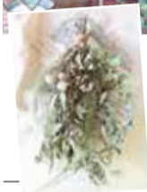
生花だけでなく、女性オーナーによる1点1点作られたオリジナルのドライフラワーのスワッグやハーバリウムなども人気

「Fleurs Dujour(日常のお花)」をテーマに、花のある心豊かな暮らしを提案している同店。生花やグリーンはもちろん、オーナーのセンスが冴えるアレンジメントや花束に定評があり、オープン以来4年口コミでも話題に!初心者も楽しめるレッスンも好評で、選んで・飾って・参加してと思いのスタイルで花をもっと身近に感じられそう!