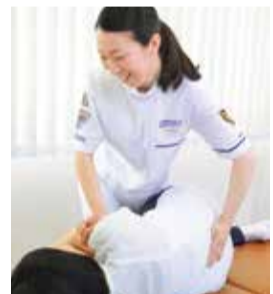
<同院の流れ> 問診→ゆがみチェック→施術→施術後の確認→運動療法→カウンセリング

「美の3大アーチ」と呼ばれる首・腰・土踏まずを正しいアーチに整え、健康だけでなく美容面でも効果が実感できるのが特徴。骨格と筋肉のアプローチで血液やリンパの流れが良くなり、痛み改善、痩せやすい体質へと導く。お年寄りや子どもでも受けられて「気持ちいい」と言われる安心の施術。