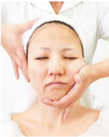
若返り、肌質改善、小顔と女性にうれしい結果をスタッフが目指してくれる。忙しい大人女性には即効性も大きな魅力。大好評につき、1ヶ月前の予約がオススメ。

田中有久子考案『造顔マッサージ』®正規継承サロン 30分で小顔&ほぐれいい線・しわを改善してグンと好印象に 卒業・入学、異動とセレクトモニーや新生活のスタートで、いつも以上に見た目気になる季節。好感度アップを目指すなら、「造顔マッサージ」がオススメ。このお手入れは世界的に著名な田中有久子先生が開発し、グランモアはその正規継承サロン。たった30分でたるみ・むくみ・しわ・ほぐれいい線などの老け要因が改善へ。小顔&アンチエイジングも叶えてくれると、メディアでも抜群の評価。その力気は、老廃物が溜まりやすい目の周りや小鼻の横、頬骨付近を中心に、皮膚表面だけでなく筋肉にまで働きかける熟練の手法。顔の筋肉はストレスや首・肩のコリ、噛みグセなどで硬くなり、血流やリンパが滞りがちで、たるみ・むくみの原因に。そこにオールハンドで「イタ気持ちいい」圧を加え、顔に溜った老廃物や脂肪を押し流し。座ってお手入れすることで血流が3倍アップして、フェイスラインが引きしまり、若々しく!小顔美人なら春のオシャレもぼつちりキマリそう!