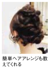
簡単ヘアアレンジも教えてくれる

リタッチや白髪染め等カラーメニューがとってもお得になるカラー会員募集中。ハリ・艶・コシ・ボリュームを与える良草カラーとオーガニックカラーで髪を艶やかにし「美し年齢-5歳」で若見えを叶えよう!「白髪が気になり3週間に1度良草カラーをしています、頭皮にやさしく、髪に艶、コシ、はりが出て染めるのが楽しみ!」など喜びの声多数の大好評なサービス。