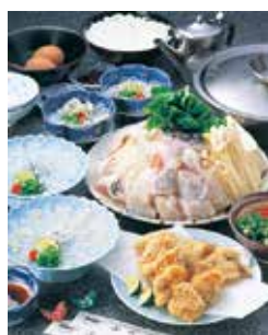
写真はふぐ義コース 2人前 【てっちり、てつき、蒲びき、煮こごり、唐揚げ、雑炊】