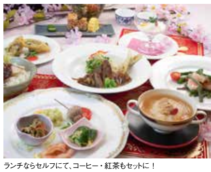
ランチならセルフにて、コーヒー・紅茶もセットに!

Menu ●至福コース……………2,500円 前菜盛り合わせ/海老と山菜の炒め/ ハマグリ入りミニ姿フカヒレスープ/ 湯葉餃子のサクサク揚げ/ 牛すね肉と玉葱のトウチ煮/中華風 蒸し鶏ご飯/ デザート/中国茶 ※カード払い不可 特典 「シティライフを見た」と予約で (3/1~4/27まで)至福コース2,500円→ ランチ(前日までの完全予約制) 2,000円 ディナー(平日火~金のみ) 2,300円 ディナーは「エビチリ」or「パンパンジー」 のいずれか一品プラス(1グループ統一)