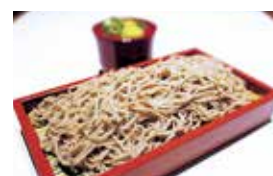
箕面本店のみで、平日15時以降提供の温冷選べる「そば」