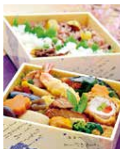
個人・団体など予算に応じた受注もOK!