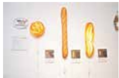
本物のパンからできたパンシェード 左)ブル 12,960円 中)バゲット 16,200円 右)バターロール 15,120円