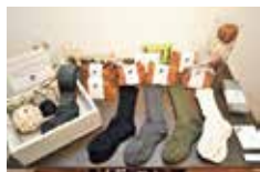
奈良の靴下職人が手がける「Ponte de pie!」の靴下(1,512円~)