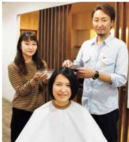
頭皮を若返らせ、元気にしながらカラーができるのが「ガジャ」の魅力。