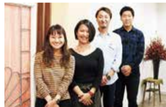
オーナーを始め、頭皮の髪の健康に真剣に向き合うスタッフたち。