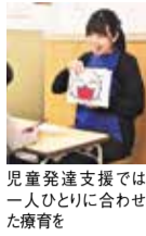
児童発達支援では一人ひとりに合わせた療育を