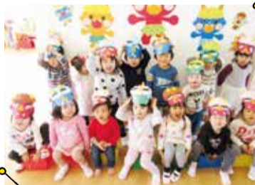
広い教室の内外で目一杯楽しみながら成長している現在のプレ生の様子はHPの「BLOG活動日記」でチェック!