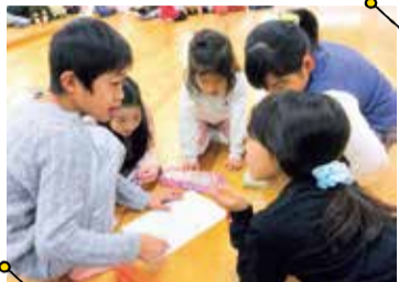
3歳~中学3年という異年齢の子たちが意見を交換し合い、協力しながら人間関係構築力を身につけていく