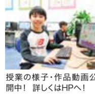
授業の様子・作品動画公開中! 詳しくはHPへ!

全国で既に40教室開校!社会に必要な「自主性」や「コミュニケーション力」がつくと評判のスクール。自ら企画を考案トライ&エラーを繰り返して、やり抜く力をつける。アイデアを出し合いながらチームで課題に取り組み、達成感へ繋げていく。クラスで発表する時間では、筋道を立てて自分の考えを伝える力も養える。IT教育の専門研修を経た講師がサポートするから初めてのお子さんでも安心!まずは無料体験へ。