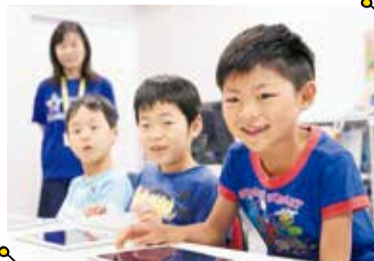
振替授業や補講対応があるので、他の習い事が忙しい子も安心!