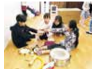
道具や効果音、歌も一から自分たちで創っていく

子どもたちが将来自分の個性を活かして社会生活を送れるよう自己表現力・コミュニケーション力などの社会力を育成していく子どもの創作音楽劇団「わお!」。音楽劇という最終目標に向けて、4月~11月は造形・音楽・身体・言葉の表現やダンス・劇遊びを専門の講師のもとで習得し、12月~3月はいよいよ劇創作。子どもたち自身で意見を出し合いながら、劇のテーマや台本を創った後は、「道具隊」「音楽隊」「役者隊」から挑戦したいものを選び、各隊で活動後、劇を完成させていく。異年齢の子どもたちが一つの目標に向かい、切磋琢磨しながら創り上げる経験は、子どもたちのさまざまな「力」を引き出し、育てていく。今年度の音楽劇は3/24(土)に公演。ぜひ観覧してみてください。