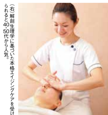
（右）解剖生理学に基づいた本格エイジングケアを受けられると40代から人気。