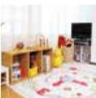
子連れの方も安心できるキッズルームではお子さまのお預かり、お食事もOK

40代50代から高い評価を得ている同店からこの時期最も相談の多いむくみ改善のメニューが登場。遠赤外線サウナで基礎体温を上げ、さらにリンパのつまりとむくみを改善してくれる。春に向け一気に引き締めたい人には、90分の集中コースがオススメ!隠れ家的マンツーマンサロンのため、こっそり通いたい人はぜひ!