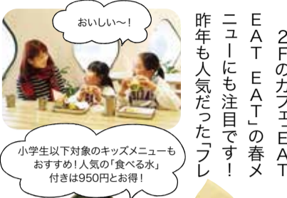
小学生以下対象のキッズメニューもおすすめ! 人気の「食べる水」付きは950円とお得!

「わざわざふれる」ゾーンで淡水フグ「パオ・アベイ」の赤ちゃん20匹の展示が、2月9日(フグの日)からスタート! パオ・アベイは、昨年3月からニフレルのバックヤードで飼育されていて、9月25日に初めて産卵が確認され、日本初の