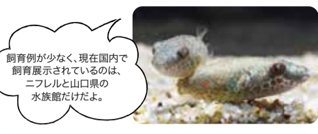
飼育例が少なく、現在国内で飼育展示されているのは、ニフレルと山口県の水族館だけだよ。