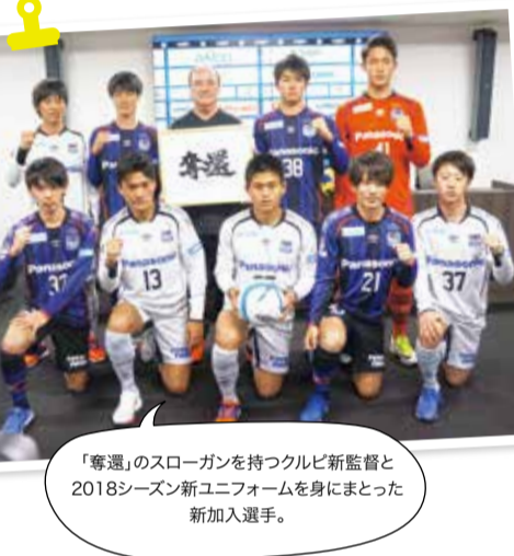
「奪還」のスローガンを持つクルビ新監督と2018シーズン新ユニフォームを身にまとった新加入選手。