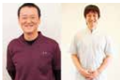
愛媛県・兵庫県の外反母趾専門家も絶賛する外反母趾専門院

特典 | 「シテイライフを見た」と予約で ●外反母趾矯正が 50%OFF ●片足(初回40分).....8,640円→ 4,300円 ●両足(初回60分).....16,200円→ 8,100円 ※詳しくは「整体王国 外反母趾」で検索を(初回限定、3月末まで、要予約)