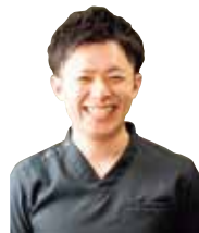
院長は柔道整復師などの国家資格を持ち、同業のプロも学びに来るセミナーの講師も務める。