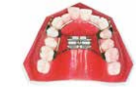
矯正治療で子どもが装着するスケルトンタイプの固定式拡大装置。中央のスクリーンを回転させて上アゴを広げていきます。

食べものも積極的に取り入れたいものです。アゴの成長不良は、子どもをよく観察するとわかります。口をポカンと開けている、ペチャペチャと音を立てて食べる、噛まずに飲み込む、食べるのが遅いといった様子が頻繁にあれば要注意です。