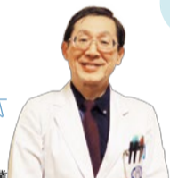
この人に伺いました

キレイで若々しい外見は、健康な体から生まれるもの。美容だけではなく、医学や漢方の知識を取り入れて、内側から輝くようなキレイを手に入れましょう。