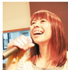
(上)発声の基礎から、豊かな表現力まで親切丁寧に教えてくれる。

今年の春は何か新しいことを始めてみよう！とお考えの方にオススメなのが、USボーカル教室。高槻駅前とアクセスの良い同教室は、気さくな先生による親切丁寧なレッスンでグングン上達していくと好評を得ている。歌を習うのが初めての方から、プロを目指す本格派の方まで幅広い層の生徒さんが通い、楽しみながらのレッスンに「気持ちが明るくなった」と喜びの声が続々。まずは、30分の無料体験レッスンに参加して教室の雰囲気を感じてみよう！