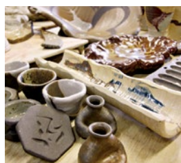
(上)窯元付属のため、自動ろくろはもちろん、型なども自由に使うことができる。

高槻市今城にある「FIELD土香」は、初めての方から熟練者まで、老若男女問わず幅広い層の方々が通う。陶芸教室1回の利用時間が9時15分~16時と長く、様々な釉薬はさることながら、焼成方法が通常の酸化焼成だけでなく、還元焼成も自由に選択可。また、特殊な冷却還元焼成も体験できる！経験豊富なスタッフが十分にサポートしてくれるので、気になったらまずはお電話を！