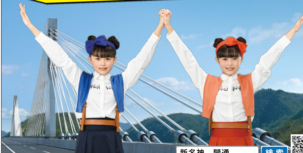
生野大橋(撮影:平成30年2月5日※一部CG補正を施しています)