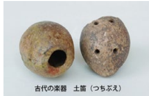
古代の楽器 土笛(つちぶえ)