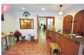
1.オーナーを始め、頭皮の髪に健康に真剣に向き合うスタッフたち。 2.落ち着いた店内、店頭にはオリジナル商品を含め、オーガニック商品の販売スペースも。

〔六甲道〕 organic shop & salon Gajah (ガジャ) 神戸市灘区深田町3-2-18 六甲ハイツ1F 営/9時半~19時 月曜、第3火曜定休 ☎078-856-3703 http://gajahpasih.com/ ガジャ パシィ で検索