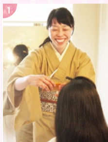
1.シャンプー剤も原則的に使わない浄水洗髪なので、超敏感肌やアレルギーの方にも安心。天然木の櫛を一人一本専用を用意してくれる嬉しい配慮も。2.和で統一されたキレイな店内。家具や照明など細部に渡りオーナーのゲストに対する配慮が。

6月に開催される2018FIFAワールドカップ ロシア。我がSAMURAI BLUEのメンバーに誰が選ばれるのか、今から気になって仕方ありません。厳しい予選グループですが、なんとか突破してほしいものです。元神戸の森岡亮太選手(ベルギー1部・アンデルレヒト所属)が選ばれたら、絶対ユニフォームを買うぞ!(そう思っているのは私だけではないはず。まっつー)