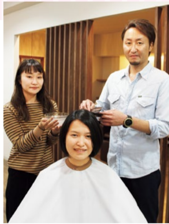
頭皮を若返らせ、元気にしながらカラーができるのが「ガジャ」の魅力。