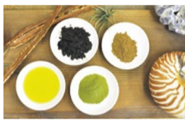
天然素材の薬草100%のモリンガオイル・マコモ・ヘンプパウダー・モリンガが、髪と頭皮を健康に導く。もちろん好みの明るさに染められる。

シティライフ読者に限り 初回の方限定 Special Menu 超・頭皮若返りカラー+カット 13,100円→8,900円 (4月末まで・要予約)