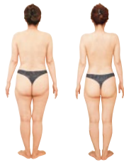
2か月間キャビリポスリムを受けて体重-6kg、ウエスト-10cmに成功!

全国ダイエット大会で優勝するなど数々のコンテスト受賞実績のある創業35年の信頼できる地域密着のエステサロン。「3か月で卒業できるダイエット」をモットーに親しみやすいスタッフが丁寧に応えてくれると評判。