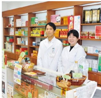
とても相談しやすい人柄でありながら、診断は的確