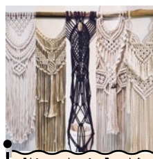
dtb arts kolektiv

フレッシュな花を自然乾燥させたドライフラワーと、それを使った手作りのアレンジメント作品。