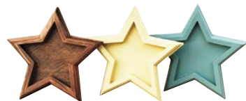
P.F WORK SHOP