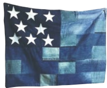
Window Ra Peach

「本当においしくて体に良いもの」を考えて作られている同店。安全な無農薬玄米を使用し、保存料・着色料は不使用。カレーごとにスパイスのブレンドを変えた味わいもぜひ味わってほしい。